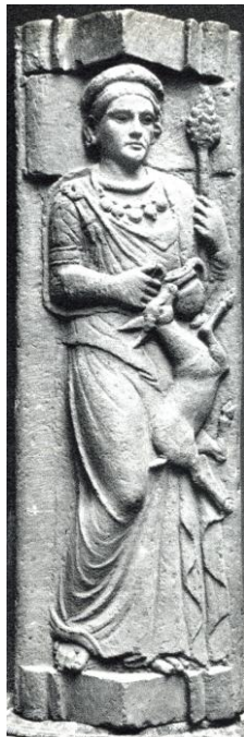
Coperchio di sarcofago da Tarquinia datato 340 a.C.

Un chiaro esempio sulla tradizione italica è dato dalla figura femminile scolpita su un celebre coperchio di sarcofago da Tarquinia datato 340 a.C. e conservato a Londra: pur se col capo posato sul cuscino del letto funebre, la defunta è raffigurata in atteggiamento ieratico, vestita di un lungo abito e di un mantello che le copre la spalla sinistra, al collo porta una vistosa collana, la mano destra regge un vasetto a due anse, il cantaro , mentre la sinistra impugna un robusto tirso , infine, so-pra la persona è disteso un piccolo erbivoro dagli zoccoli fessi, forse un cerviatto oppure un capretto, tipica vittima rituale nel culto di Dioniso, e questo particolare ci riporta subito alla memoria il cucciolo tenuto con la mano sinistra dal bronzetto di Contarina. Di conseguenza, mentre non presenta alcun elemento che la possa in qualche modo collegare con la figura di Ercole, la nostra misteriosa statua presenta ben due attributi inconfondibili, che fanno pensare a Dioniso!