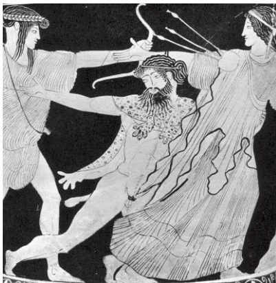
Scena interpretata come tentativo del gigante Tizio di rapire Latona, madre di Apollo (ceramica attica del 475-450 a.C.).

Limitando la nostra indagine alla sola iconografia classica, notiamo che sono parecchi i personaggi raffigurati con addosso una pelle di animale: per fare solo qualche esempio, su un cratere attico del 475~450 a.C. conservato al Louvre di Parigi, il gigante Tizio è dipinto con una pelle di leopardo trattenuta sulle spalle dalle zampe anteriori legate sul davanti, proprio come il satiro raffigurato su un'anfora attica del 450~425, pure conservata al Louvre.