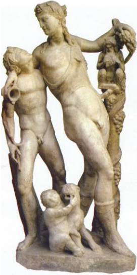
Scultura ellenistica con Dioniso e seguaci: con tutto ciò che sottintende una simile immagine, la reazione del Senato romano appare scontata.

C. si spostarono ad Occidente, risalirono il corso del Danubio e si diffusero un po' ovunque nell' Europa centrale ed occidentale e in quella mediterranea centro-orientale, portando con sé le loro credenze, le loro tradizioni ed i loro costumi.