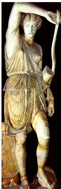
Amazzone Mattei: copia di un'opera di Fidia databile alla metà del V secolo a.C.

storiche sedi a Nord del Mar Nero dall'avanzata degli Sciti, nel corso del IX ed VIII secolo a.