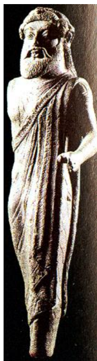
Fufluns: bronzetto etrusco del 480 a.C. da Modena.

A mio avviso, tuttavia, la spiegazione della presenza in area venetica del bronzetto etrusco di Contarina potrebbe risiedere nel fatto che, essendo i Veneti un popolo italico, l'immagine poteva essere oggetto di culto anche presso di loro, poiché nella statuina essi vedevano il simulacro di quello, che anche nella nostra Regione era venerato quale nume tutelare della fertilità della Natura.